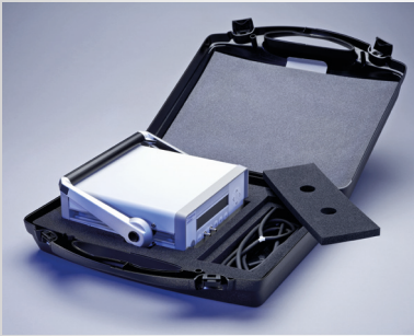
Transportkoffer KAL 100 / 200 Best.-Nr. 9220.0002