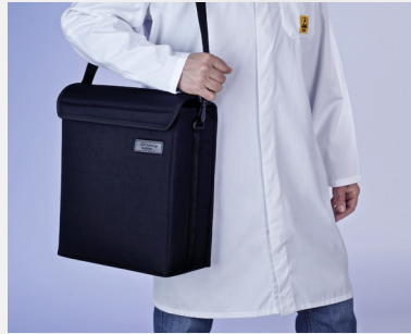
Tragetasche KAL 100 / 200 bereits im Lieferumfang enthalten