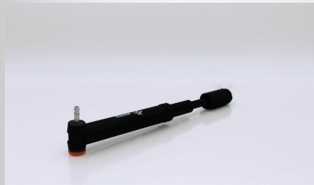
Handpumpe KAL 84 Best.-Nr. 9601.0036