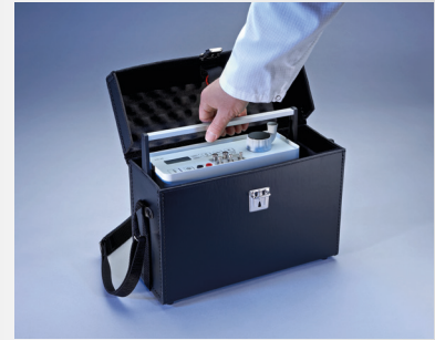
Tragetasche KAL 84 Best.-Nr. 9062.0001